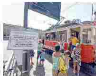
Il tram 116

■ Nella domenica solidale della città, l'Atts, l'associazione torinese tram storici, ieri ha devoluto le offerte dei passeggeri che sono saliti a bordo del tram 116 a Specchio dei Tempi, per raccogliere fondi per i terremotati. Dalle 15 alle 19 (un'ora in più del previsto) 200 torinesi hanno viaggiato sul tram più antico della città, costruito nel 1911, con un pensiero alle famiglie sopravvissute al sisma. Sono stati raccolti 416 euro: una cifra