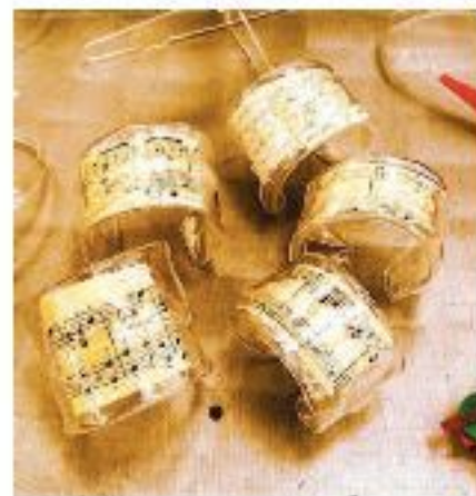
● Artigianato d'autore