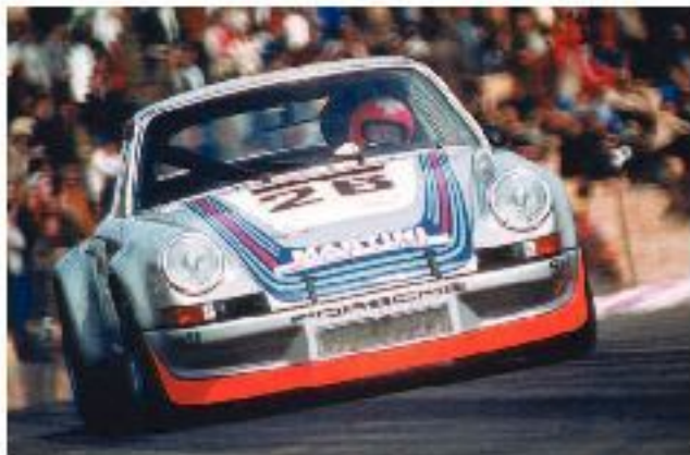
● Il Museo dell'Auto dedica una mostra al mito Martini Racing