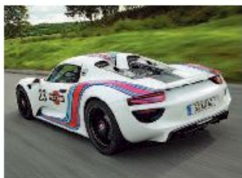
● Una Porsche 918 Spider

tive per conoscere i protagonisti, le vittorie e i segreti delle vetture. Spazio anche al design e agli spot più famosi della Martini, con una ricca selezione di poster ormai diventati oggetti di culto tra gli appassionati. Orari di visita: lunedì 10-14; martedì 14-19; mercoledì, giovedì e domenica 10-19; venerdì e sabato 10-21. Biglietto intero 8 euro, ridotto 6, scuole 2,50 (ingresso gratuito per i possessori dell'Abbonamento Musei e della Torino+Piemonte Card). Info 011/67.76.66-7-8, www.museoauto.it.