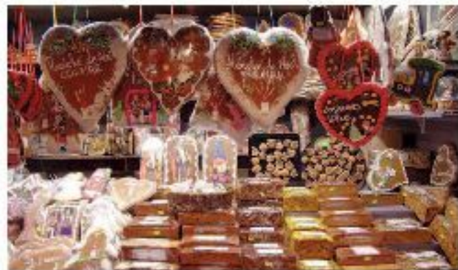
● Ci saranno anche i dolci alsaziani

Baguettes e croissants appena sfornati, biscotti bretoni, 85 qualità di formaggi, salumi, vini prestigiosi, spezie, crêpes e gaufres, ga-