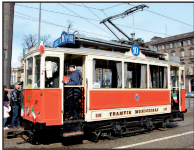
La vitura 116 con ij sò 100 ani

Ai 17 ëd mars a l'han pijà l'andi ij festegiament për arcordé ij 150 ani da l'Unità d'Italia e, con l'ocasion, un tranvaj èstòrich a l'ha fàit ëd gir për le contrà dël sénter sitadin portand a spass chi a l'avia gòj ëd monteje ansima. La vitura a l'era la 116, un tranvaj che a compia pròpi col di li ij 100 ani; an efet a l'é un-a dle 130 viture costruie da la dita Diatto, na fàbrica che, ant ël 1911 quand ch'a j'ero arcordasse ij 50 ani d'Unità, as trovava sle rive dël Pò, davzin a la cesa dla Gran Mare. Ant lè scond dòp-guèra le viture a j'ero stàite butà, pòch a la vira, feura servissi o trasformà an tranvaj për manutension.