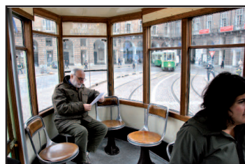
Andrinta a un-a dle viture