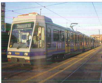
Tram 7030 au dépôt de Venaria

Dimanche 6 décembre : la matinée était consacrée à la visite de la ligne Torino - Ceres maintenant exploitée par GTT. Sa gare historique dans Turin est abandonnée, remplacée par un terminus provisoire dans le quartier de Dora. Le bus 11 nous y conduit. Notre visite de la ligne, bien préparée par José, se fait avec un couplage de rames automotrices "Belges" différentes, dont une en "inox", qui datent du milieu des années 50 (ALe054). Le train 17 quitte Dora à l'heure en direction de Ceres. Étonnante cette ligne, qui commence avec un caractère "banlieue", puis rural, pour se terminer en ligne de montagne aux courbes serrées et aux