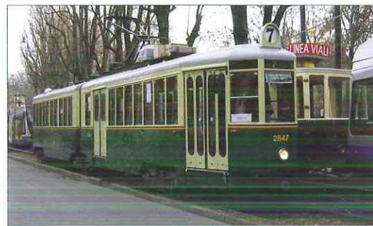
Tram 2847 en circulation au parc Reale lors du Trolley Festival