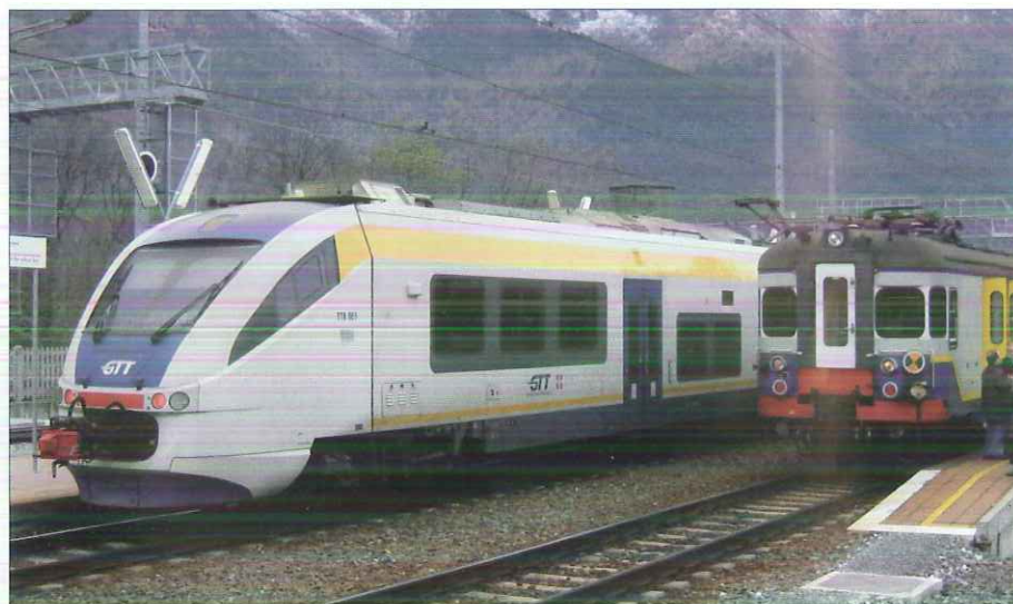
Locomotive historique FTC à Cirié