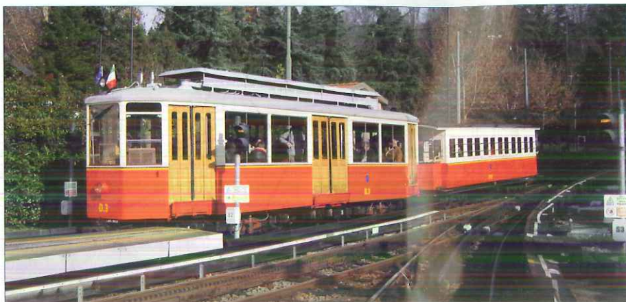
Motrice D3 et remorque D12 arrivant à Sassi

Le challenge est d'arriver au grand dépôt de Venaria avant la nuit, malgré des automobilistes qui, parfois, ont du mal à sortir des emprises des rails. Visite détaillée, commentée en français. Nous pouvons y découvrir un "tram-restaurant"... pour la prochaine fois! Nous donnons ci-contre le parc de matériel actuel des GTT, la liste des lignes exploitées ainsi que celle du matériel entretenu par l'ATTS. Retour à Sassi pour le repas du soir, puis à Porte-Neuve où se situe notre hôtel.