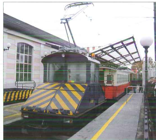
Le tracteur T 450 manœuvre la remorque D 12 à Sassi

Samedi 5 décembre : notre groupe quitte l'hôtel en direction de l'arrêt de la ligne 15 le plus proche, notre premier contact avec GTT (transports turinois). Grâce aux « pass », nos déplacements en transports publics sont plus aisés. Notre tramway articulé est bien plein, nous irons jusqu'à l'avant-dernier arrêt, à Sassi, pour prendre le tram qui « monte » à Superga, nom de la colline qui surplombe Turin, sur laquelle a été édiflée une grande basilique. Jusque dans les années 30,