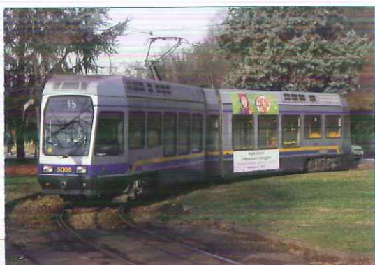
Tram 5008 sur la boucle de la ligne 15 à Coriolano près de Sassi

Le relief se plisse, la neige fait son apparition et nous voilà à Limone, fin du 3 kV, la frontière sera passée dans le tunnel. Malgré le temps uniformément gris, le paysage est spectaculaire, alors que les boucles se succèdent, nous permettant de voir la voie que nous allons