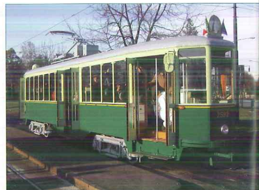
Tram historique 2592 au terminus 15 à Coriolano près de Sassi

Lundi 7 décembre : le départ de la gare centrale de Turin est à 7h30, par le train régional "trenitalia" à destination d'Imperia. C'est un train de quatre voitures remorqué en diesel, malgré la présence de la caténaire jusqu'à Limone. Lors de la définition de ce voyage, nous n'imaginions pas emprunter une circulation "historique" puisque ces convois sont assurés par autorails depuis le nouveau service.